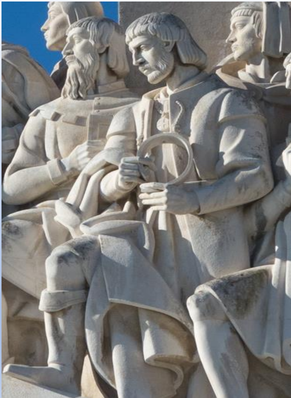
MAGALLANES EN EL MONUMENTO A LOS DESCUBRIDORES PORTUGUESES (BELÉM, LISBOA).