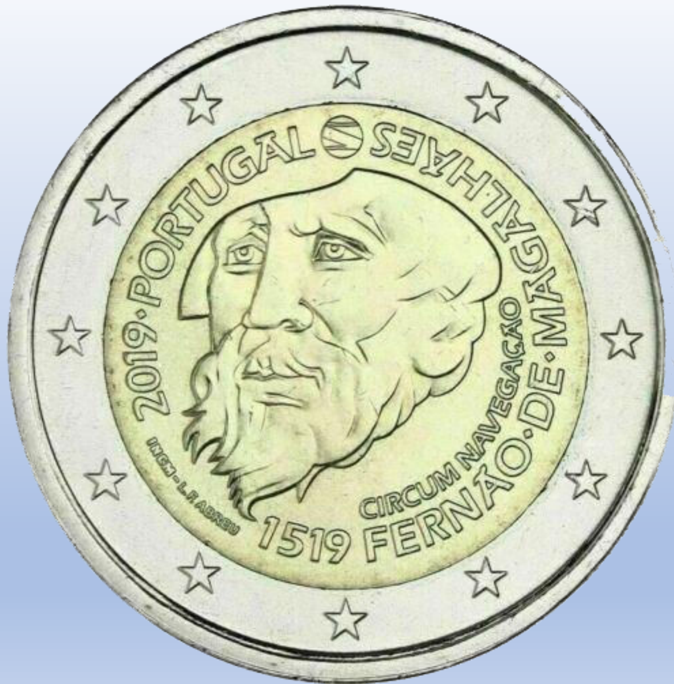
PIEZA DE DOS EUROS. CASA DA MOEDA (LISBOA).