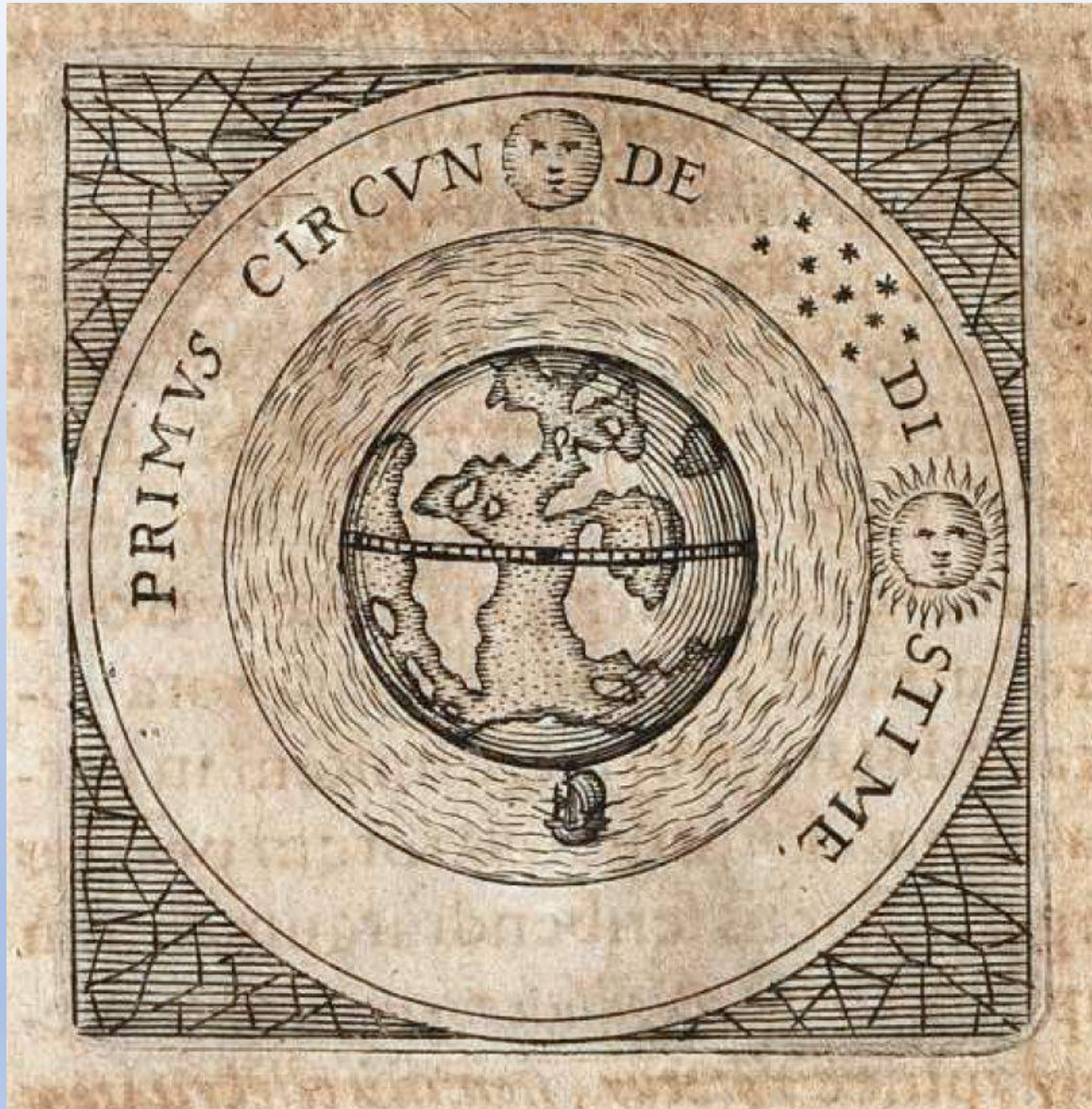
LA DIVISA DE ELCANO EN LA OBRA DE NEUGEBAUER.