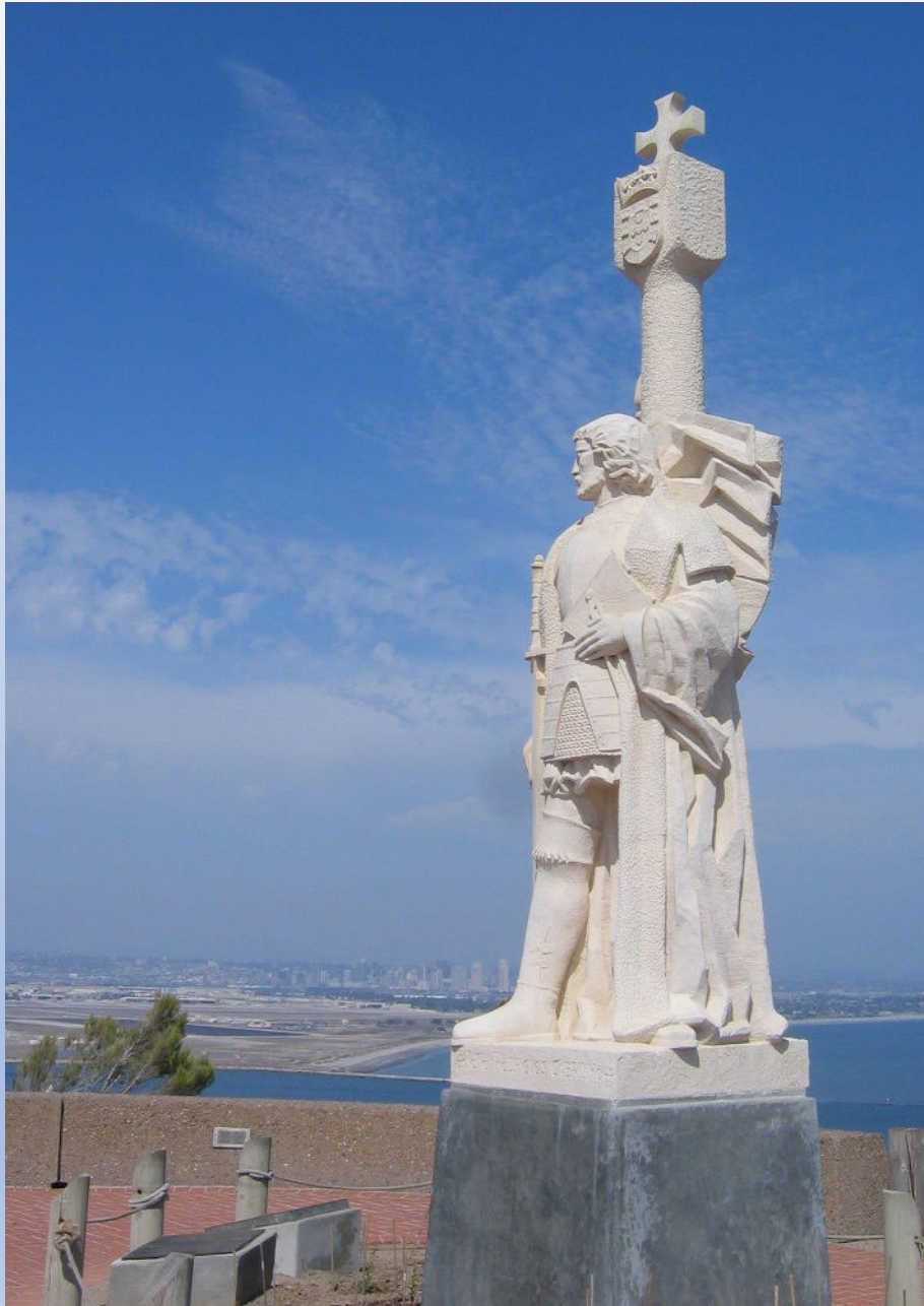
MONUMENTO A CABRILLO (BAHÍA DE CALIFORNIA).